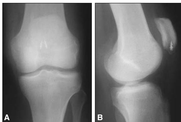
Figura 4. A y B. Vista de los arpones a nivel de polo distal rotuliano.