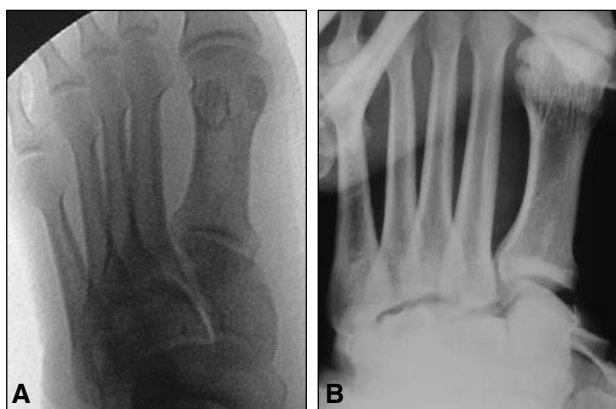
Figura 3. A y B. Radioscopia estática intraquirúrgica y maniobra de estrés en abducción.