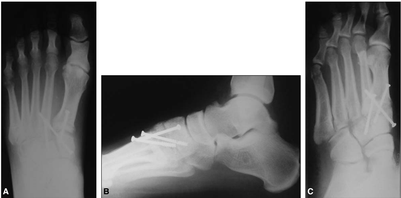
Figura 6. A y B. Osteosíntesis de columna medial y media mediante tornillos canulados de 4 mm. Radiografías de frente y de perfil. C. Oblicua.

Se destacan para el análisis los siguientes aspectos: