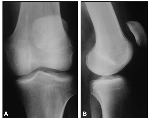
Figura 1. A y B. Rótula alta. Radiografías de frente y de perfil.

Al ingresar el paciente en el quirófano le llamó la atención al equipo quirúrgico la presencia de equimosis y hematoma plantar izquierdo, por lo que se lo interrogó nuevamente antes de operar el aparato extensor; asimismo, se realizó una exploración física y radiológica (fluoroscopia e imágenes estáticas) del pie (Fig. 3A). Se completó el estudio mediante pruebas de estrés clínicas y radiológicas, las cuales evidenciaron inestabilidad tarsometatarsiana, variedad convergente externa de las columnas medial y