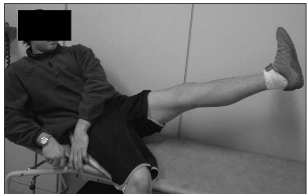
Figura 7. Paciente con extensión activa completa de la rodilla.

La inestabilidad tarsometatarsiana es una lesión que pasa inadvertida con cierta frecuencia en la consulta de emergencia. Según distintos autores, 8,11 alrededor del